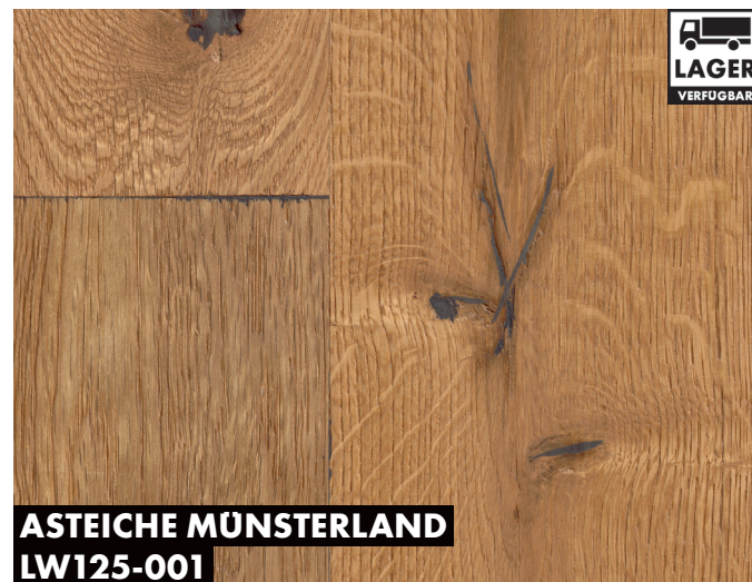
ASTEICHE MÜNSTERLAND LW125-001